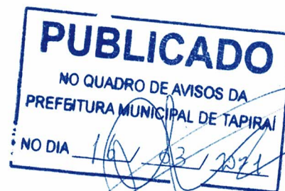
VANDERLEI CASSIANO DE RESENDE Prefeito Municipal